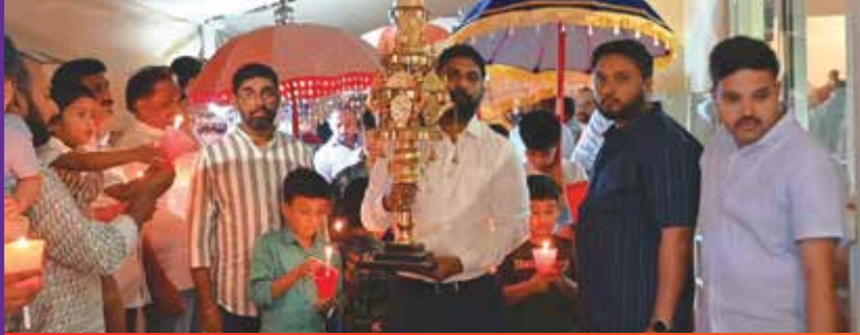
വിശുദ്ധ ഗീവർഗീസ് സഹായുടെ ഓർമ്മപ്പെരുമാളിൽ നിന്നും