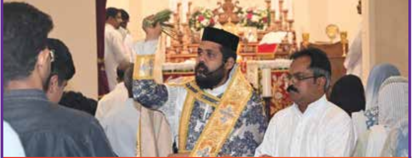
പെന്തക്കോസ്തി പെരുമാൾ രൂപരൂഷയിൽ നിന്നും