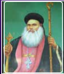
യുയാക്കിം മാർ ഈവാനിയോസ് മെത്രാപ്പോലീത്ത (പരുമല പള്ളി) 101ാം ഓർമ്മ