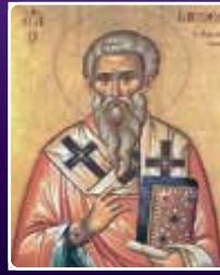
മാർ യാക്കോബ് ശ്ലീഹ