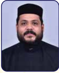
Co - Vicar's Message

വി. ശ്ലീഹന്മാരുടെ ജീവിതചരിത്രവും അവരുടെ ദൈവശാസ്ത്ര വീക്ഷണങ്ങളും ഇന്നത്തെ അസ്തിത്വ പ്രതിസന്ധികൾക്ക് എങ്ങനെ മറുപടി നൽകുന്നുവെന്നും നമ്മെ എങ്ങനെ സ്വാധീനിക്കുന്നുവെന്നും നോക്കാം.